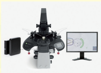
Saturn5™Active 連続自動照射レーザーシステム