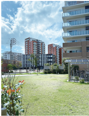
クリニックの遠景

私は、産婦人科から生殖医療の領域で長い間診療を行い、多くの病院や医院、クリニックで働いてきました。そしていろいろな先生方の志を仰ぎ、不妊治療・生殖医療の分野で成長することができました。プロフィールにもあるように、鹿児島大学医学部を卒業後、久留米大学産婦人科、国立小倉病院産婦人科、久留米大学産婦人科、東京の国立成育医療センター不妊診療科、福岡の蔵本ウイメンズクリニック、沖縄のALBA OKINAWA CLINIC、同じ沖縄で空の森クリニック、そして久留米大学医学部産科婦人科で博士号を2017年に取得し、空の森KYUSHUの院長を歴任後、セントマザー産婦人科に非常勤医師として勤め、今年の9月にここ福岡市東区の香椎浜にて福岡ARTクリニックを開院いたしました。