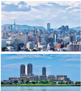
福岡市内のビル群とアイランドシティ

福岡ARTクリニックは、福岡市の東区、アイランドシティ近くにあります。街のキャッチフレーズに「このまちの日々が未来の暮らしにつながっていく」とある様に、私たち新クリニックは婦人科、生殖医療を通してこの街、そして福岡の元気で幸せな未来づくりに貢献したく2025年9月に診療を開始いたしました。