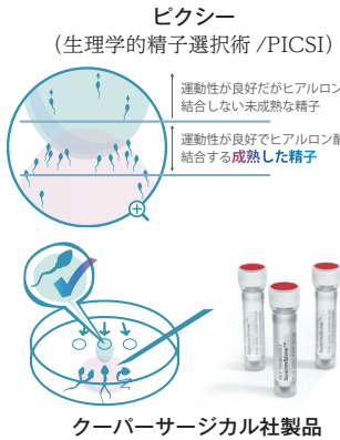
クーパーサージカル社製品

長い間の診療を通して、私は不妊治療(生殖補助医療ⅡART)の技術面では、最前線の治療を行うことができると自負しています。 実際にARTでは、排卵誘発、採卵、胚移植の各ステップにおいて、細部にこだわりながら技術を磨き続けてきました。たとえば難治性の不妊症であっても「なんとかうまくいく方法はないか」と、あらゆる可能性を患者さんと共に熟考し、工夫を重ねながら治療に臨んでいます。その姿勢において、決して手を抜かず、科学的根拠に基づいた個